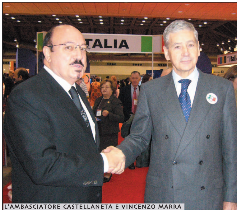
L'AMBASCIATORE CASTELLANETA E VINCENZO MARRA